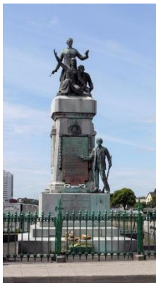
El "Memorial 1916", emplazado en Limerick.

declararon la independencia de Irlanda y una república. También están escritos los nombres de los 16 hombres que fueron ejecutados en mayo, luego del levantamiento, y en los paneles laterales figuran los 65 hombres que murieron en combate.